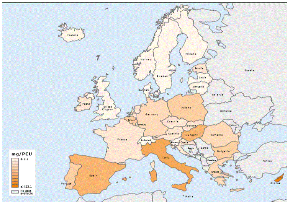
Figure 10. Spatial distribution of overall sales of all antimicrobials for food-producing animals, in mg/PCU, for 31 countries, for 2017